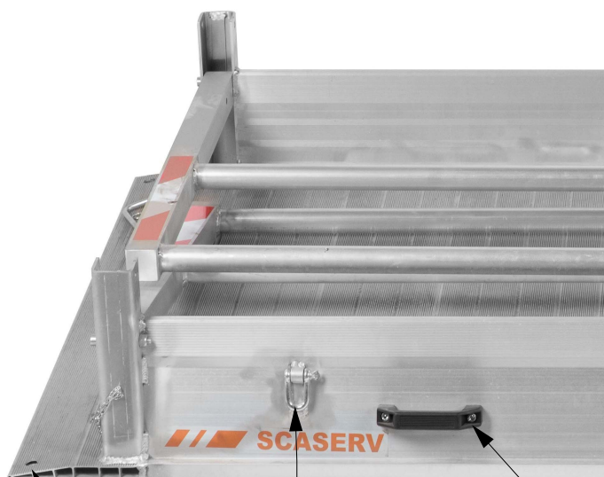
Závěsné oko pro přepravu jeřábem